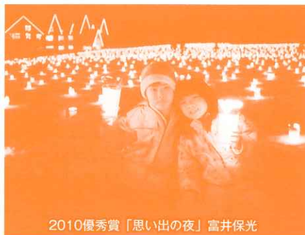
2010優秀賞「思い出の夜」富井保光